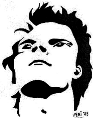
“Der Kopf” *